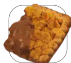
① Biscuit Snack Cornflakes Choco