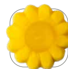
Mangue avec Maracuja

..... Votre contribution optionnelle à l'environnement – suppléments respectifs sur demande