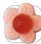
Framboise avec Cassis