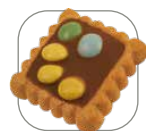
③ Biscuit avec dragées au chocolat multicolores et crème au chocolat

..... Votre contribution optionnelle à l'environnement – suppléments respectifs sur demande