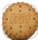
Biscuit avec crème au cacao

Contenu : 1 pièce Grammage : env. 7 g Format : 45 x 72 mm Colisage : 250 pièces Film : film OPP blanc Impression : 4c quadri