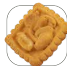
② Biscuit Snack Cacahuètes caramélisées